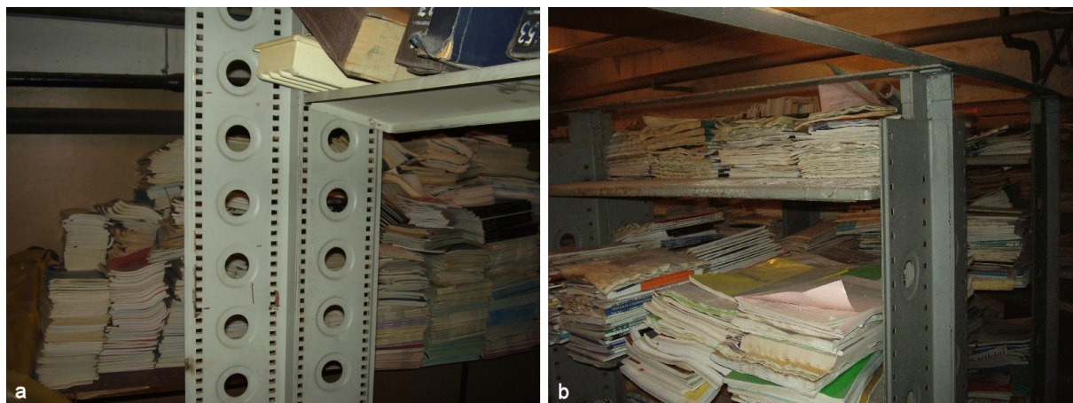
Abbildung 3: Im Keller der Zentralen Medizinischen Bibliothek (ZMB) in Moskau. Gestapelte, nicht zugängliche Zeitschriften der Jahre 1990–2010 (a) und Zeitschriften mit Wasserschaden (b).

bestellt werden, weil sie sich im Keller befinden (Abbildung 3a) [2], [3]. Auch einige neuere Ausgaben werden nach dem Eintreffen sofort in den Keller verlagert und stehen deswegen dem Leser ebenfalls nicht zur Verfügung. Wegen wiederholter Schäden durch Auslaufen von Wasser, Überschwemmungen und Renovierungen ist auch die russischsprachige Literatur teilweise nicht mehr verfügbar (Abbildung 3b).