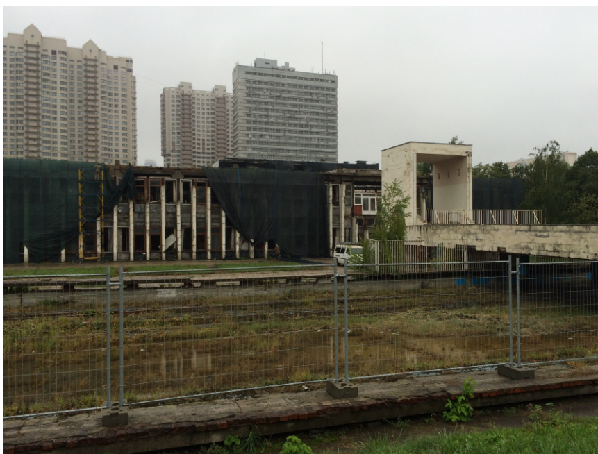
Abbildung 5: Das INION-Gebäude im Jahr 2017, nachdem die Bibliothek bei einem Brand in 2015 große Schäden erlitten hatte