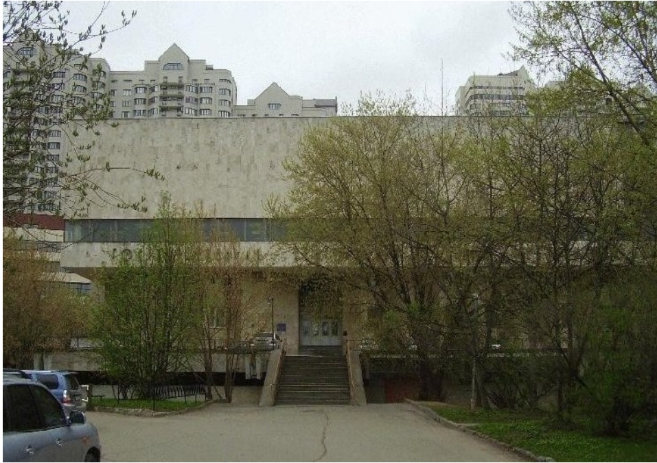
Abbildung 1: Die Zentrale Medizinische Bibliothek (ZMB) in Moskau, erbaut im Jahr 1978