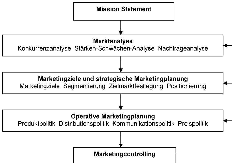
Abbildung 1: Marketing-Managementprozess – in Anlehnung an [3], S. 7, und [4], S. 95, entwickelt

und Kunden – zu denen vornehmlich Studenten und Studentinnen, Ärzte und Ärztinnen, Wissenschaftler und Wissenschaftlerinnen sowie die Industrie gehören – an ihren Standorten Köln und Bonn, im Internet, per E-Mail, per Fax oder Post zur Verfügung ( http://www.zbmed.de/ueber-uns.html Bestände der ZBMED).