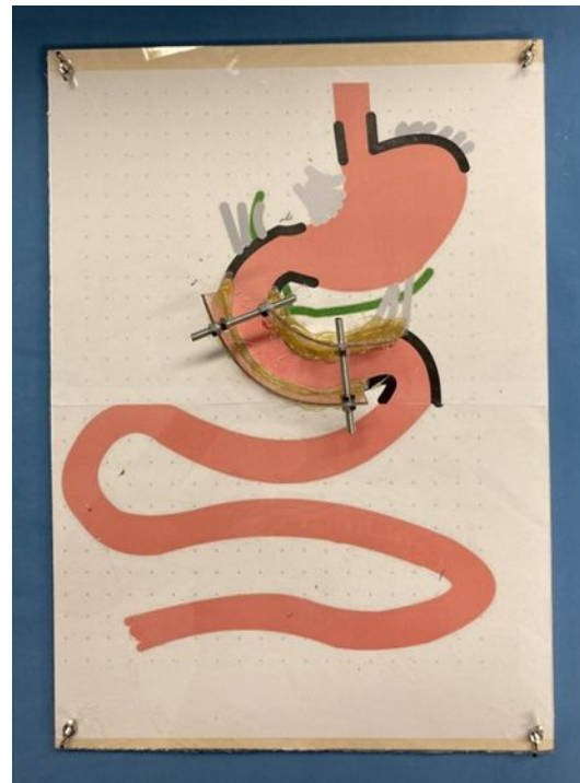
Abbildung 1: Interaktive Anatomieschablonen: Auf einer Holzplatte ist ein gedrucktes Bild der Anatomie aufgeklebt. Die Stellen der Anatomie, die schwarz umrandet sind, stellen Begrenzungen dar, welche in echten Patient*innen nicht mobilisiert werden sollen (z.B. das Retroperitoneum). In Grau sind die stabilisierenden Ligamente dargestellt, die bei verschiedenen Manövern mobilisiert werden könnten. Entlang der schwarzen Linie sind auf beiden Seiten Begrenzungen aus Acrylglas eingeklebt, so dass die Studierenden die Knete nicht auf der Platte verschieben können. Die Knete lässt sich lediglich in den freien Bereichen mobilisieren und verschieben. Der Anatomieschablone ist ebenfalls mit einer Acrylglasplatte versiegelt und auf die Holzform aufgeschraubt. Die verbauten Materialien lassen sich allesamt kostengünstig in einem Baumarkt erwerben.

Der Zeitplan für die Umsetzung des Wahlfaches ist in Tabelle 4 aufgezeigt.