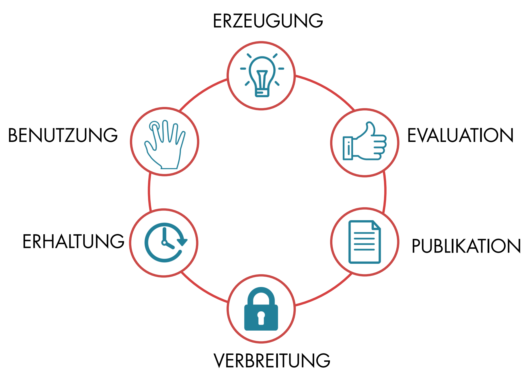
Abbildung 1: Publikationszyklus aus Sicht der Wissenschaftler.

Aus Sicht der Universitätsmediziner stellt sich der Publikationsprozess wie gezeigt dar: