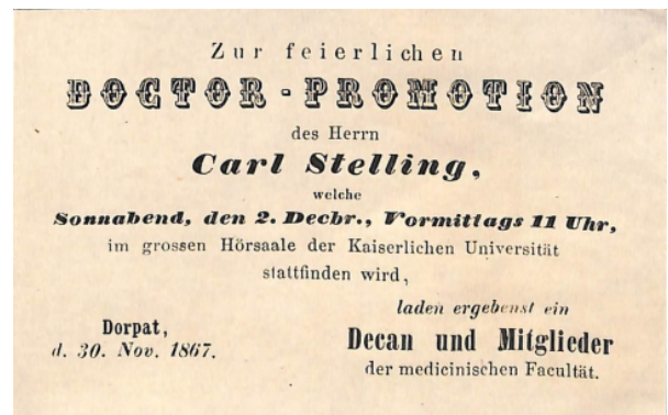
Abbildung 2: Einladungskarte zur feierlichen Doctor-Promotion des Herrn Carl Stelling, 30. November 1867