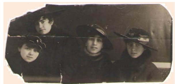
Abbildung 4: Bild aus einem Buch der Bibliothek der medizinischen Gesellschaft in Charkiw, wahrscheinlich Studentinnen, ca. 1910–1920